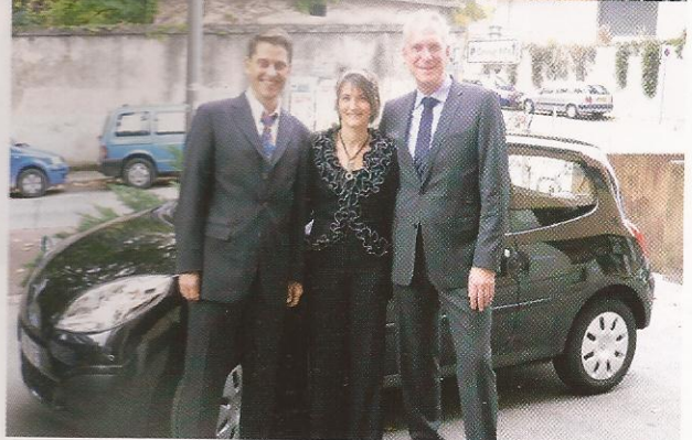
Notre première Twingo LR et bientôt notre première Mercedes Familiale Class C

novembre 2008 (3 mois après) nous étions à 16%, en mai 2009 (8 mois après) nous étions à 21% et en Décembre 2009 (15 mois après) nous faisons notre premier mois de qualification leader d'organisation.